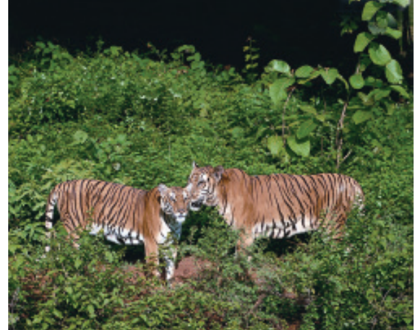
चित्र 1.3 भारत के विभिन्न चिड़ियाघरों में वन्य प्राणी